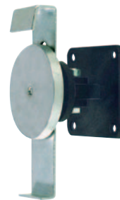
Support anti-réarmement sur contre-plaque articulée